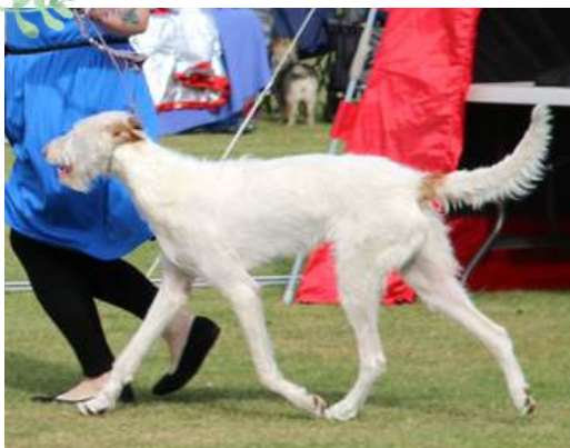
Bella De La Sierra De Avila

Ågare: Sanna Persson