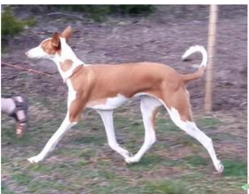
Yellow Eye's Occra

Ågare: Casandra Nors