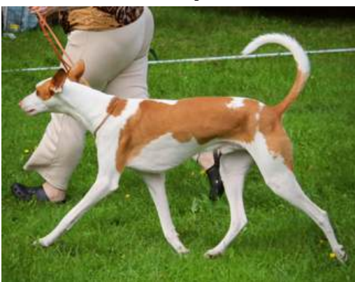
Abbotsoak's True Phantom

Ågare: Mia Karlström