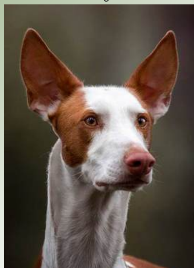
Abbotsoak's True Phantom Ägare: Mia Karlström