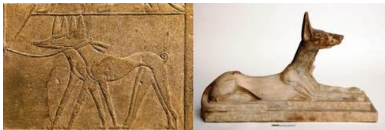
En ristning från Mererukas grav i Saqqara (ca. 2345 f.Kr.) En kalkstensstaty av Anubis från EES-utgrävningarna i Saqqara (ca. 750 f.Kr.)

Rasens ursprung tros sträcka sig tillbaka till det gamla Egypten, där arkeologiska fynd från så tidigt som 3400 f.Kr. har dokumenterat hundar av en liknande typ i form av statyer, målningar och ristningar.