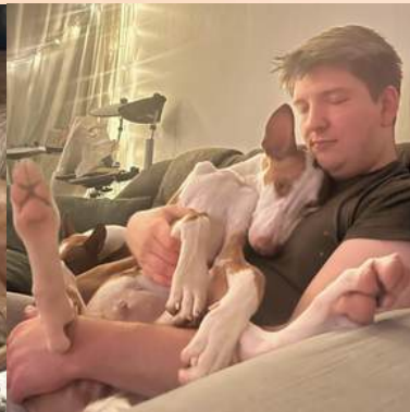
Blandade bilder på Havanna, Junie, Ellen, Nico, Sushi och Ori