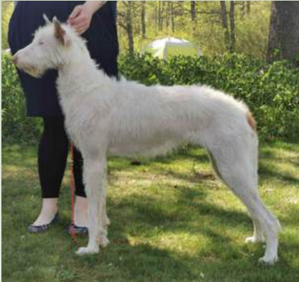
Bella De La Sierra De Avila

Foto: Sanna Persson. Ågare: Sanna Persson