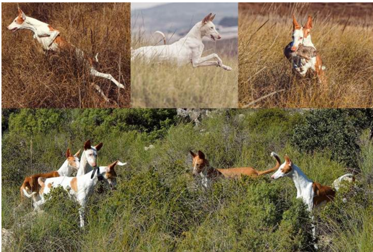
Alamira De Entresaltos - Kali-Ma - Diana De Entresaltos De Entresaltos-flocken i jakt

Det är olagligt att använda rasen för jakt i Sverige, detta eftersom rasens storlek, samt sätt att jaga på, klassas som hetsjakt. Detta betyder inte att hundarna inte vill jaga, och de allra flesta har en väldigt stark jaktlust . På grund av detta kan det vara svårt att träna rasen till att gå lös, och ytterst få individer har en pålitlig inkallning.