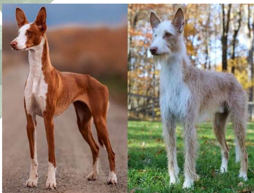
Korthår - Red Stripe Bora Bora Boar Hunt. Strävvhår - Altamirá's Bear To Be Wild.

Podenco Ibicencen är en ståtlig och elegant hundras. Den är högre, smacker och utstrålar styrka och smidighet utan att ge ett tungt intryck. De stora, upprättstående öronen pryder ett relativt litet, smalt och långt huvud, med vackra gyllene ögon som utstrålar intelligens och jakt driv. Rasen kommer i två olika hårlag: korthårig och strävvhårig . Dessa hårlagen tävlar separat i utställningsringen, men tillsammans i andra grenar som tex. Lure Coursing.