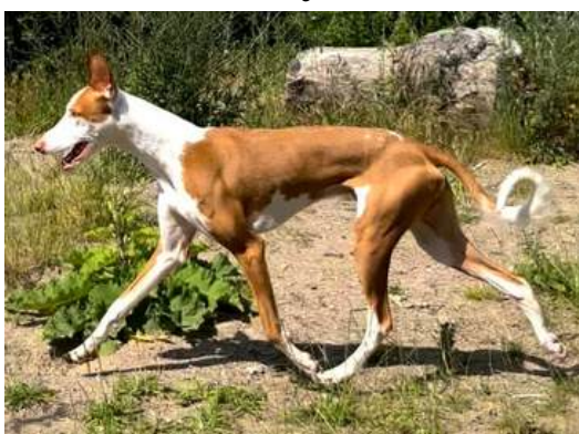
Phantom Acires Dream Hunter

Ågare: Sanna Persson