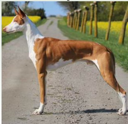
Phantom Acires Dream Hunter

Ågare: Casandra Nors