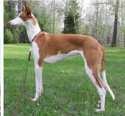
Yellow Eye's Occra

Ågare: Mia Karlström