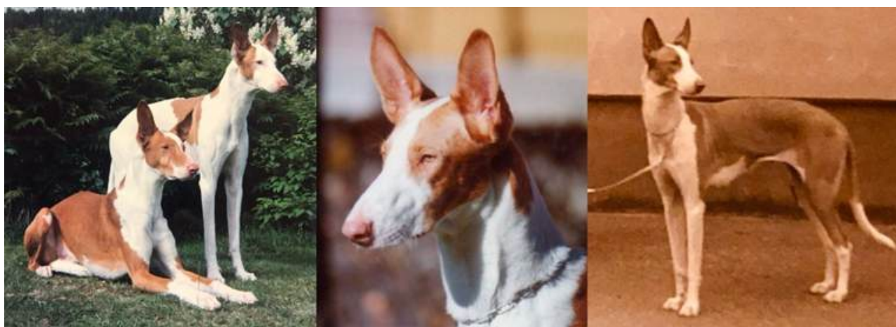
Sinsline Claudilo & Sinsline Cerbetus, bröder från Sveriges andra podenco ibicenco kull. Sin's Gamekeeper & Ivicen Sphinx, föräldrar till Nordens första podenco ibicenco kull.

Sedan 1976, när rasens första svenskfödda kull kom till världen, fram till december 2025 så har sammanlagt 35 valpkullar fötts i Sverige . Dessa är fördelade på 27 korthåriga kullar, 7 strävåriga och en kull med blandat hårlag. Det största uppehållet utan några Podenco Ibicenco-kullar i Sverige var mellan 1994 och 2004, då det inte föddes några kullar under hela 10 år.