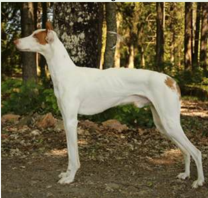
Ferdinand II Baltas Vejas

Ågare: Sanna Persson