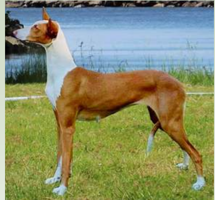
Hamfington Lady Gaga