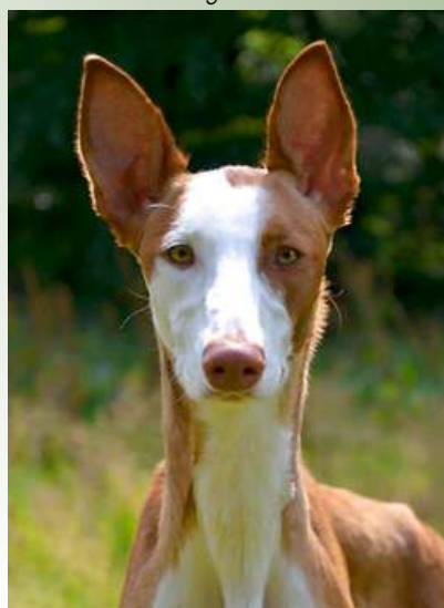
Afrodite Rjabina De Bergerac Ägare: Sanna Persson