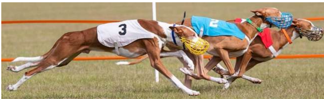
Kapplöpning – Kamars Final Trick, Kamars Double Winchester & Kamars Speed Of Light.