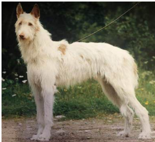
Strävårig Podenco Ibicencon