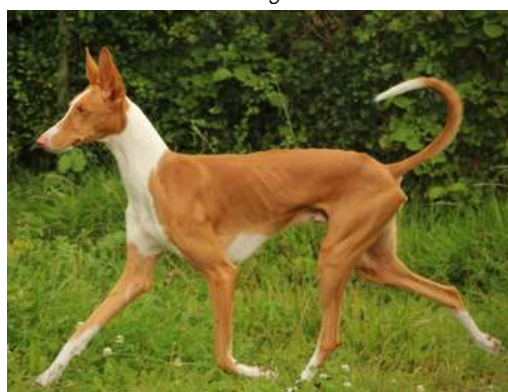
Atragon's Red River Rock

Ågare: Nellie Jönsson