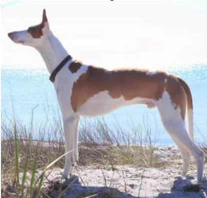
Abbotsoak's True Phantom

Ågare: Mia Karlström