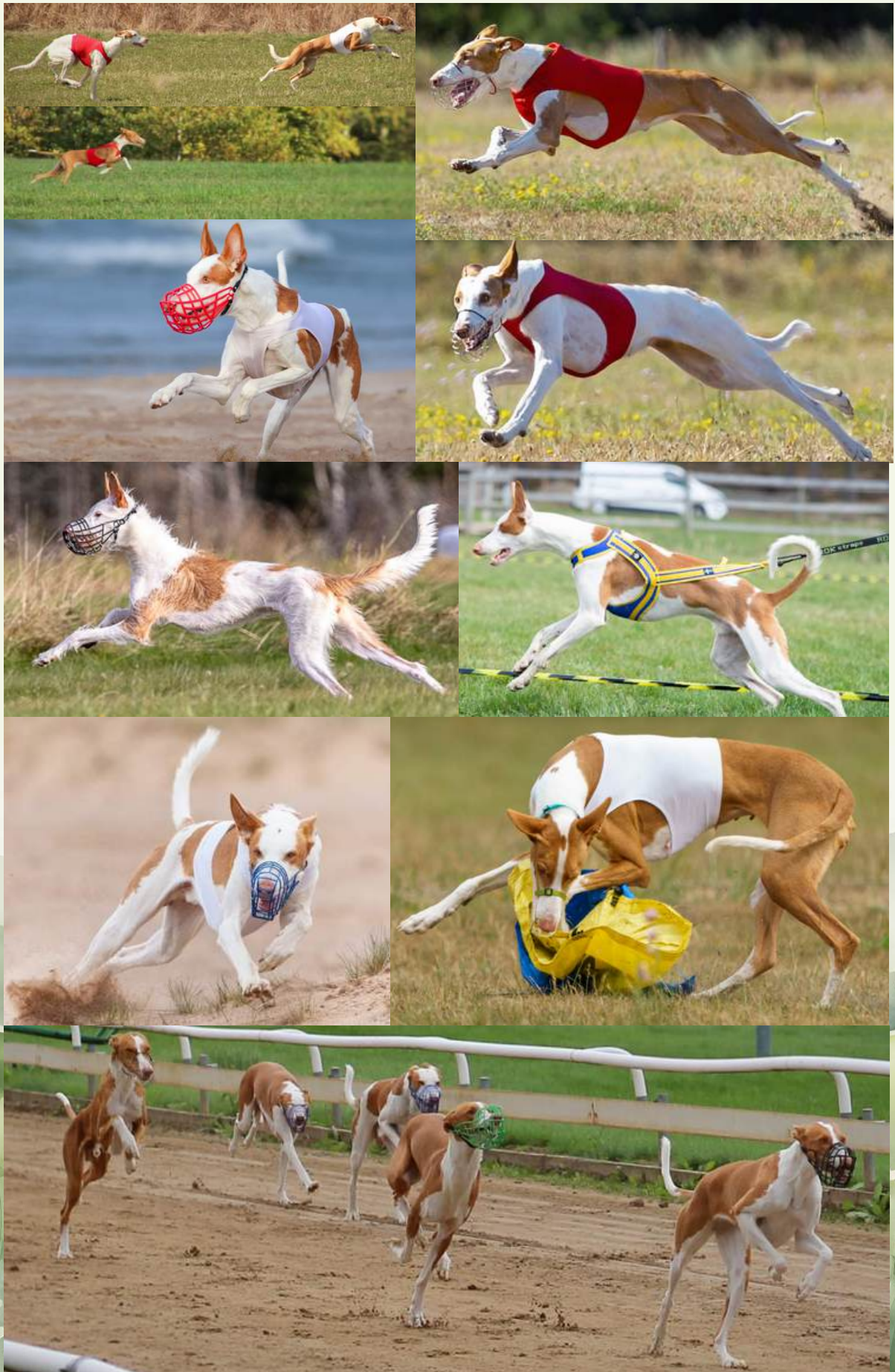
Blandade bilder på Dobby, Ori, Nico, Cobra, Bubbél, Zafira, Tyra, Karajj, Trissan, Leijdi och Nelly