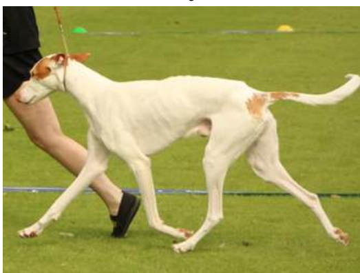
Ferdinand II Baltas Vejas