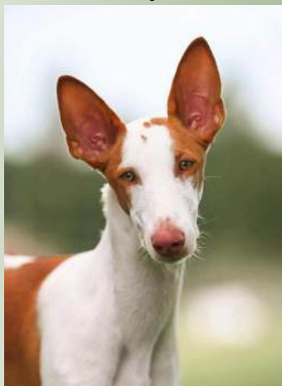
Chiron's You Got Me Singing Foto: Kristiina Tammik. Ägare: Gunilla Kock-Hansson