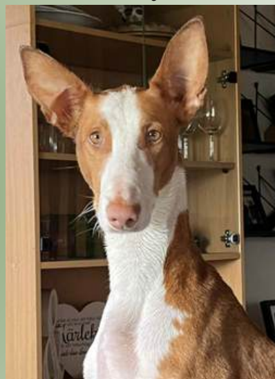
Hamtington Lady Gaga Foto: Sanna Persson. Ägare: Sanna Persson