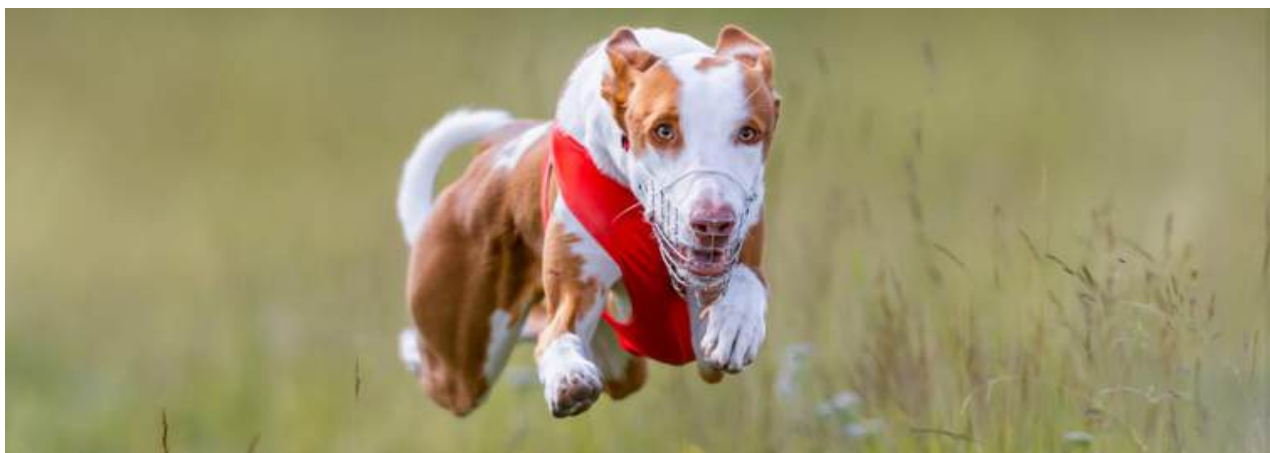
Lure Coursing – Phantom Acires Dream Hunter.