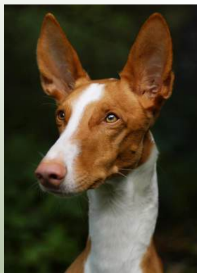
Atragons Red River Rock Foto: Nellie Jönsson. Ägare: Nellie Jönsson