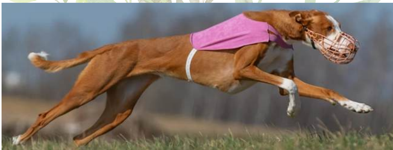
Lure Coursing – Antitheus A Little Bit Of Magic Zecora.

Om de tycker något är roligt, utför de uppgifterna med hjärta och stolthet. Eftersom det är en urhund kan Podenco Ibicencen uppfattas som självständig och egentänkande – de gör ofta inte saker gratis.