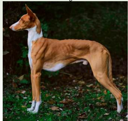
Atragons Red River Rock

Foto: Nellie Jönsson. Ågare: Nellie Jönsson