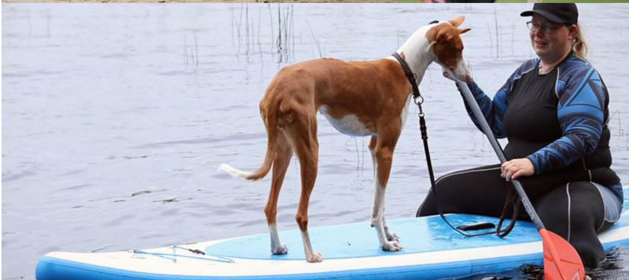
Viltspår: Atragon's Red River Rock. Foto: Nellie Jönsson Rally Lydnad: Kamars Kissed By The Sun. Foto: March Huff Photography Utställning: Phantom Acires Dream Hunter. Foto: Anki Nilsson Agility: Kamars Always On My Mind. Foto: RZ Martin Stand Up Paddle Board: Atragon's Twistin'Patricia. Foto: Nellie Jönsson