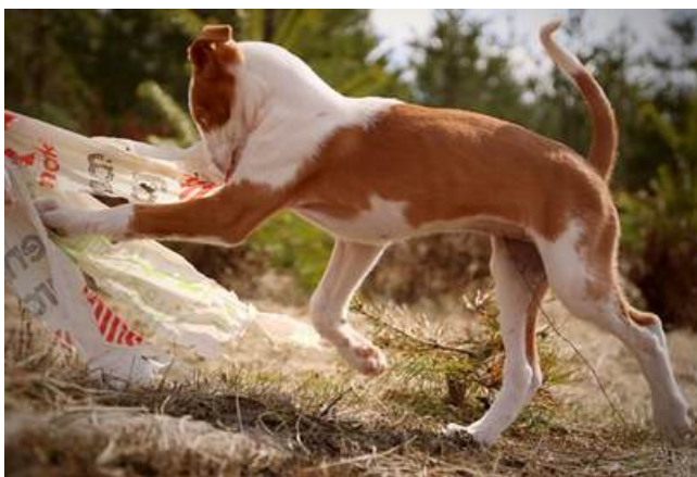
Valp som leker med en flirtpole Atragons Chasing The Ghost rider

För att ge hundarna utlopp för sin naturliga jaktlust tävlar och tränar många i antingen Lure Coursing eller kapplöpning , men det finns även leksaker och redskap som till exempel flirtpoles som ofta är väldigt uppskattade.