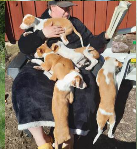
Blandade bilder från kennel Kin-Chin, kennel Sincline och kennel Atragens.