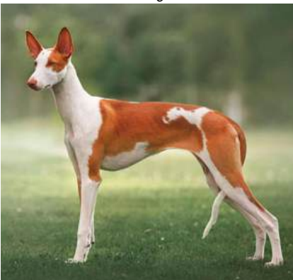
Chiron's You Got Me Singing

Ågare: Annica Kroon