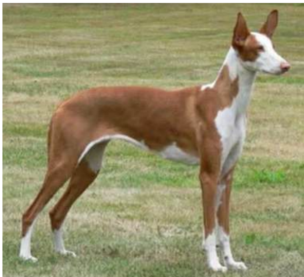
Korthårig Podenco Ibicencon

Silhuetten är rätlinjig och avviker från de vinthundsliknande kurvorna som hittas hos den anglo-europeiska och afro-asiatiska vinthundgruppen. Rasens bröstorg och vinklar i framdelen är särskilt unika, med relativt långa och öppet vinklade skulderblad och överarmar, vilket sänker armbågens placering och skapar en särskild fronthållning som inte återfinns hos någon utav kusinraserna. Resten av bröstkorgen och revbenen är flata, vilket ger en mycket smal front. Denna specifika konstruktion är en stor anledning till rasens enastående jaktstil. Rasen har ett exceptionellt väderkorn och mycket god hörsel, egenskaper som under jakt oftare används än synen. Detta är en avledningarna till att Podenco Ibicencon inte anses vara en äkta vinthund, utan snarare en urhund av vinthundstyp .