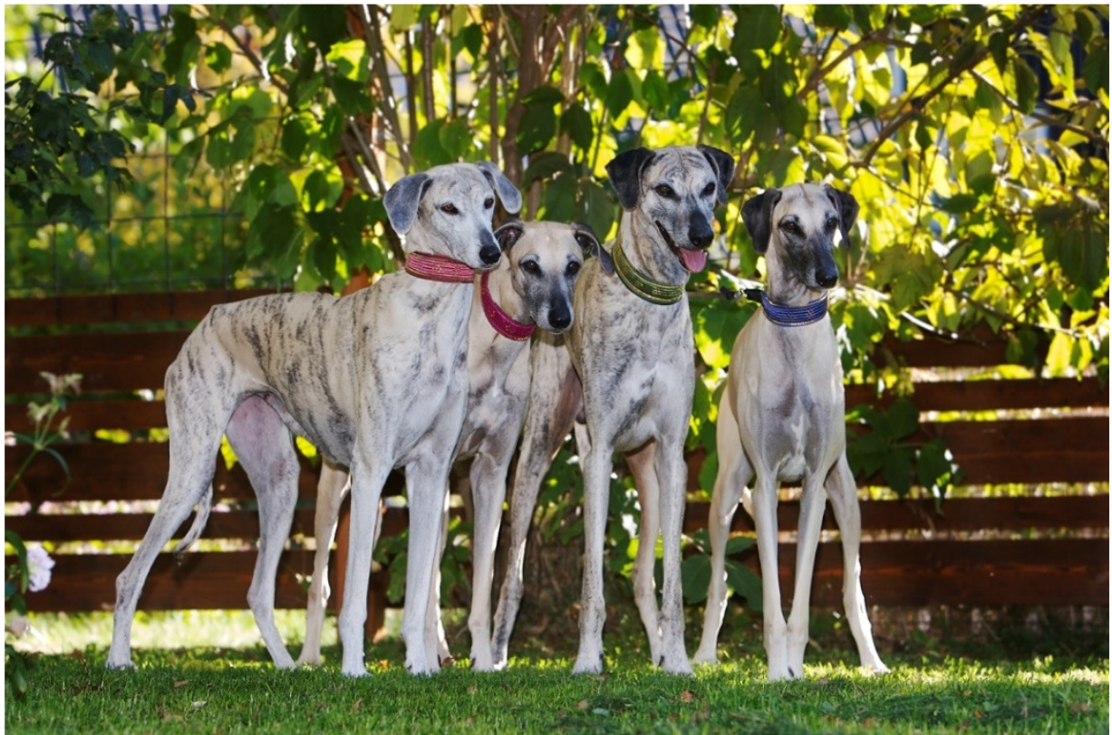
Från vänster till höger – två tikar, en hanhund och en tik, alla av utmärkt typ och könsprägel.

Höftbensknölna ska vara väl synliga och alltid i nivå med eller något högre belägna än manken.