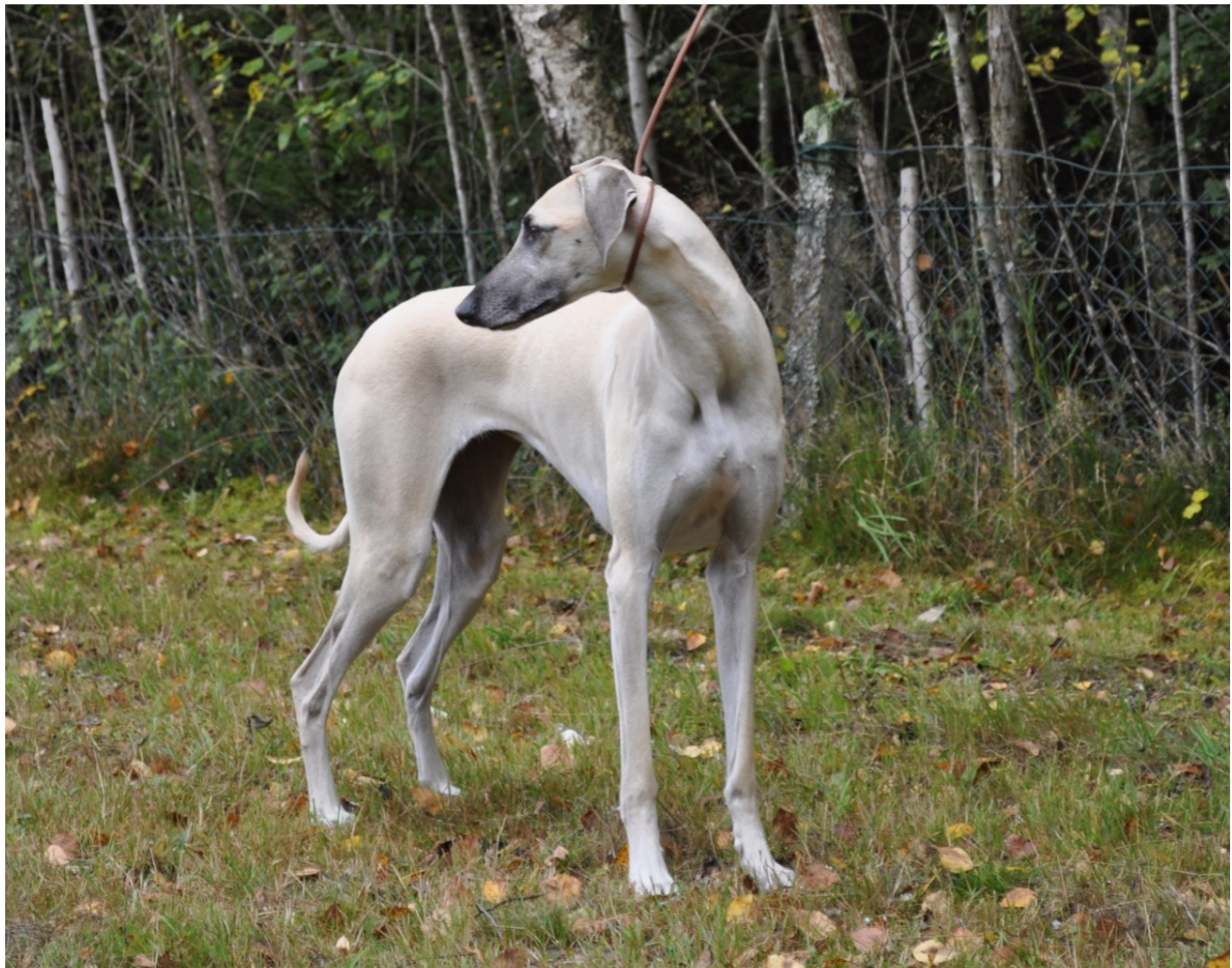
Sloughi har ett ganska mjukt linjespel.

Sloughin har öppna vinklar fram och bak. Man ska få en tyllig uppfattning om att benen är lodrätt ställda. Det ganska branta korset och de öppna bakbensvinklarna gör att hunden i stående inte täcker mycket mark. Hasorna är inte särskilt låga. Som helhet har sloughin ett ganska mjukt linjespel.