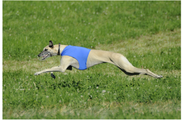
Sloughins bruksprov är som för andra vinthundar lure coursing.