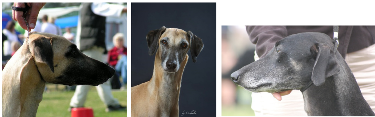
Det triangulära intrycket från alla håll är väsentligt för rastypen och förstärks av öronansättningen.