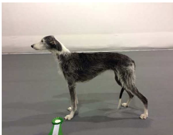
En väl bibehållen veteran

Hundar av utmärkt kvalitet men som kan ha mindre detaljfel.