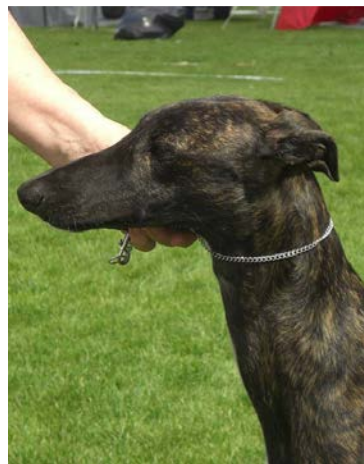
Bilder som visar den lätt konvexa struplinjen