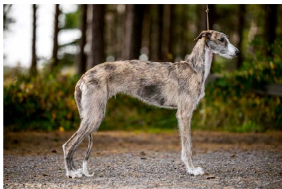
Juniorhane, ej färdig i sin utveckling