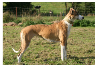
Magyar agár mest kortlinjerad