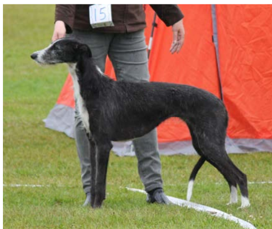
Tik ca 5 år gammal