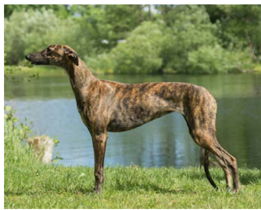
Exempel på två utmärkta hundar, särskilt notera de korrekta över- och underlinjerna där bröstkorgsdjupet inte når ner till armbågarna.