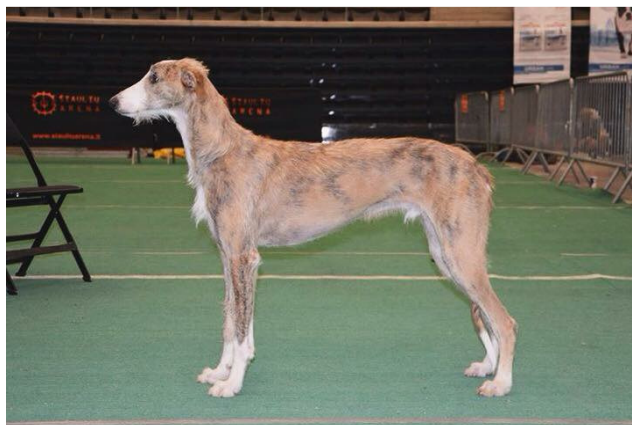
Dessa två bilder är till för att illustrera de två hårlagen.