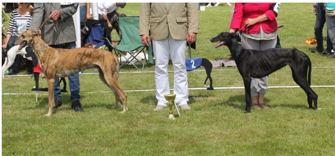
TVå utmärkta hundar där den svarta hunden har ett något brant kors. Båda hundarna har bra proportioner, huvud med divergerande plan, utmärkt bröstkorg som inte når ner till armbågen samt svansar av utmärkt längd.

Standarden beskriver en lätt rektangulär vindhund med elegans och balanserade proportioner (utan överdrifter) – långt huvud med divergerande plan och mycket lång svans och med generös kapacitet i bröstkorgen. Däremot måste man tydliggöra att det handlar om en hund med lättare konstitution (benstomme och kroppsvolym) och med mindre uttalade vinklar än greyhunden vilket inte framgår tydligt nog av standardens formulering och översättningen. Viktigt att den inte ger intryck av att vara för grov eller att ha ett runt och kraftfullt linjespel. Jämför man en galgo español och en utställningsgreyhound så är en galgo español betydligt mindre generöst tilltagen på alla vis än greyhunden även om det ädla och fina hos en galgo español aldrig får ge en för spröd framtoning. Den spanska standarden säger "tren trasero ben aplomado y musculado" borde tolkas som "bakstället mäktigt och muskulöst".