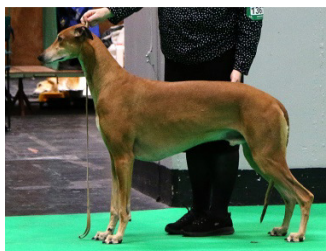
Greyhound mest långlinjerad