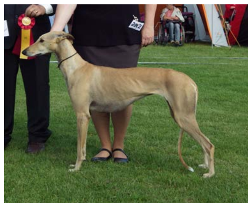
Tik ca 5 år gammal