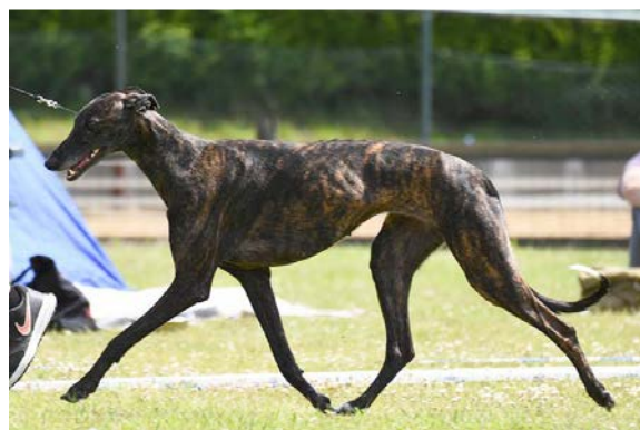
Bilderna visar rastypiska lätta rörelser där den högra hunden uppvisar en balanserad helhet.