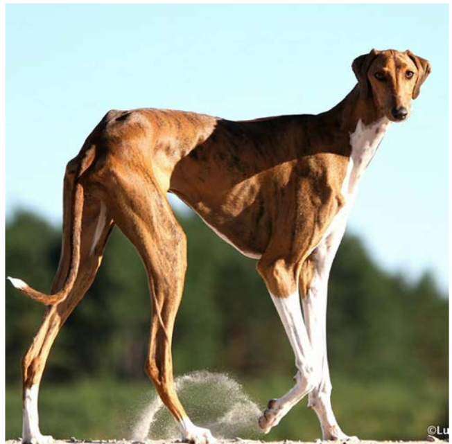
Tydliga överlinjer med markerade höftbensknölar i nivå med eller högre än manken.