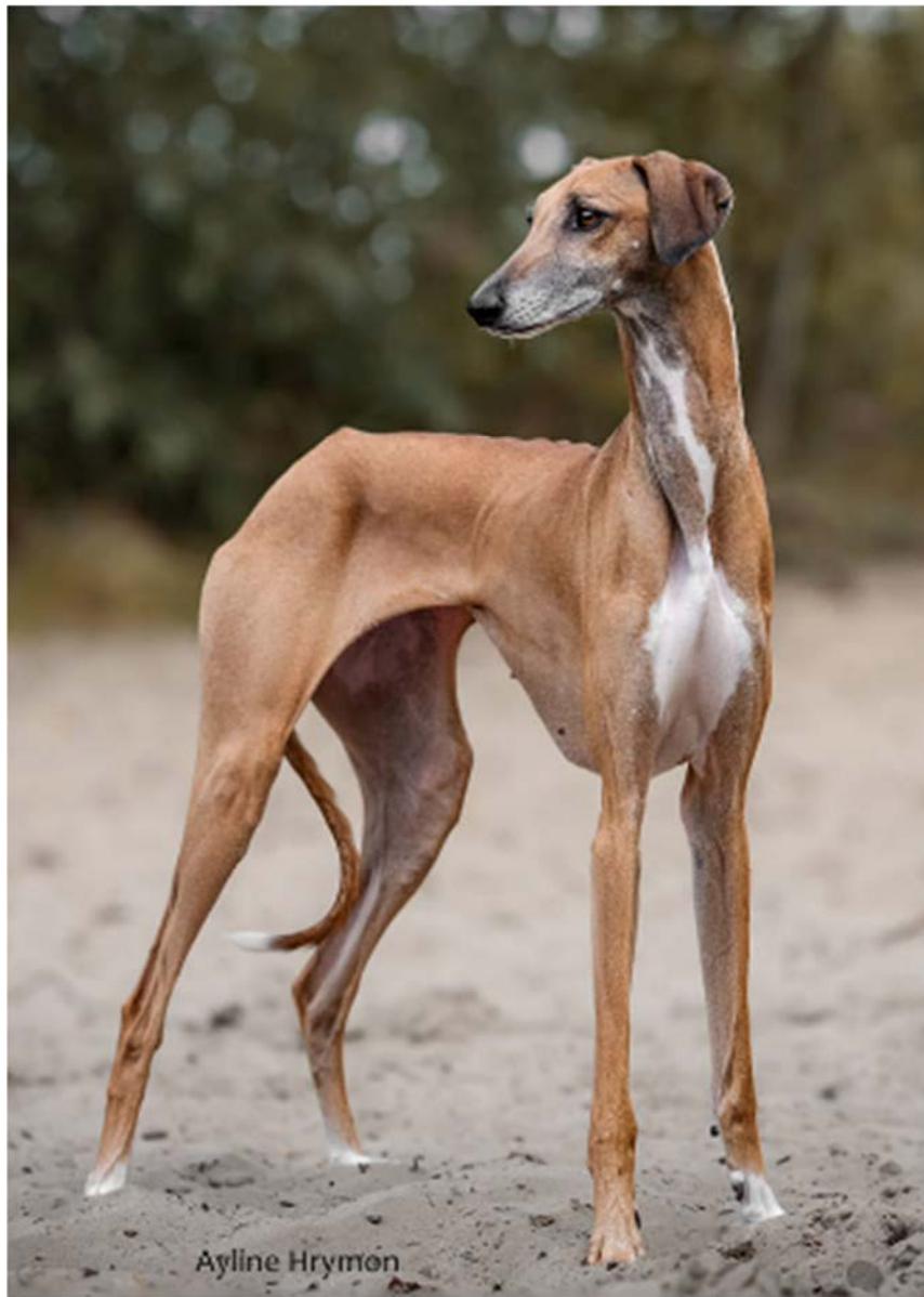
Härlig tik med tydligt långa, torra, vertikala framben, hon har också en utmärkt bröstorg i form, djup och bredd.