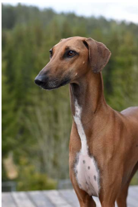
Utmärkt tikhuvud med mycket bra uttryck, vackra ögon och välburna öron.