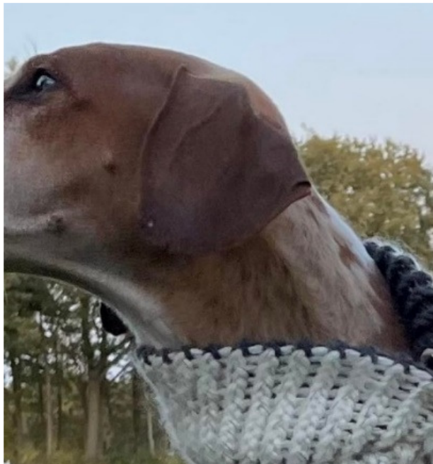
Exempel på vinterpäls på halsen.