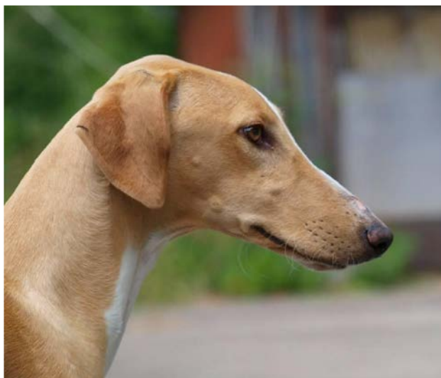
Divergerande plan i huvudets profil förekommer ofta i rasen.

Skallpartiet ska vara tydligt elegantare och smalare än hos sloughin.