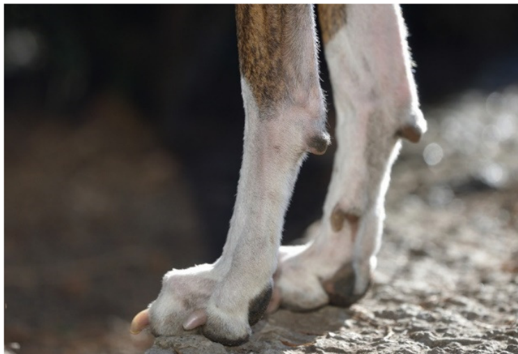
Här ser man tydligt den mycket korta pälsen på tassarna. Klorna är välvårdade.