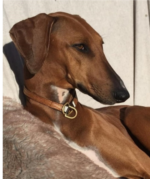
Långa, eleganta, torra och finnejslade huvuden med fina detaljer och proportioner.