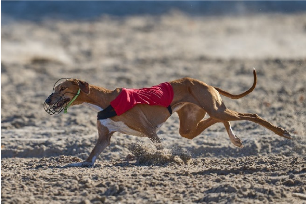
Klorna är hundarnas "spikskor" som behövs för att få gott fäste i underlaget när de springer, till exempel på lure coursing.