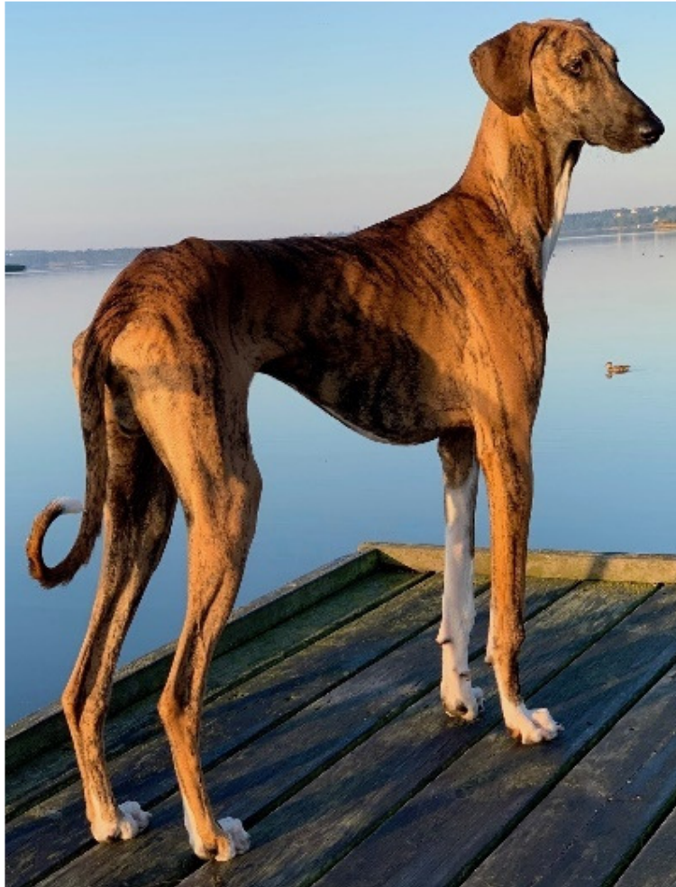
Utmärkt helhet med långa, torra bakben och utmärkta, öppna bakbensvinklar.