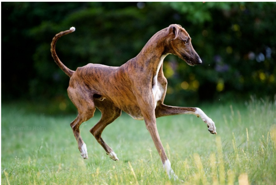
En hanhund i utmärkt hull som visar slankhet och elegans, med tunn och stram hud.